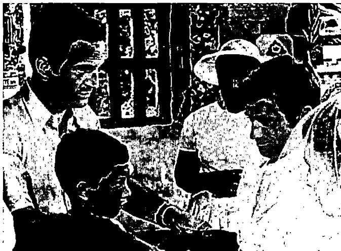
Tournage de « La Sirène du Mississippi » à l'île de la Réunion. François Truffaut préside au mariage de Jean-Paul Belmondo et Catherine Deneuve